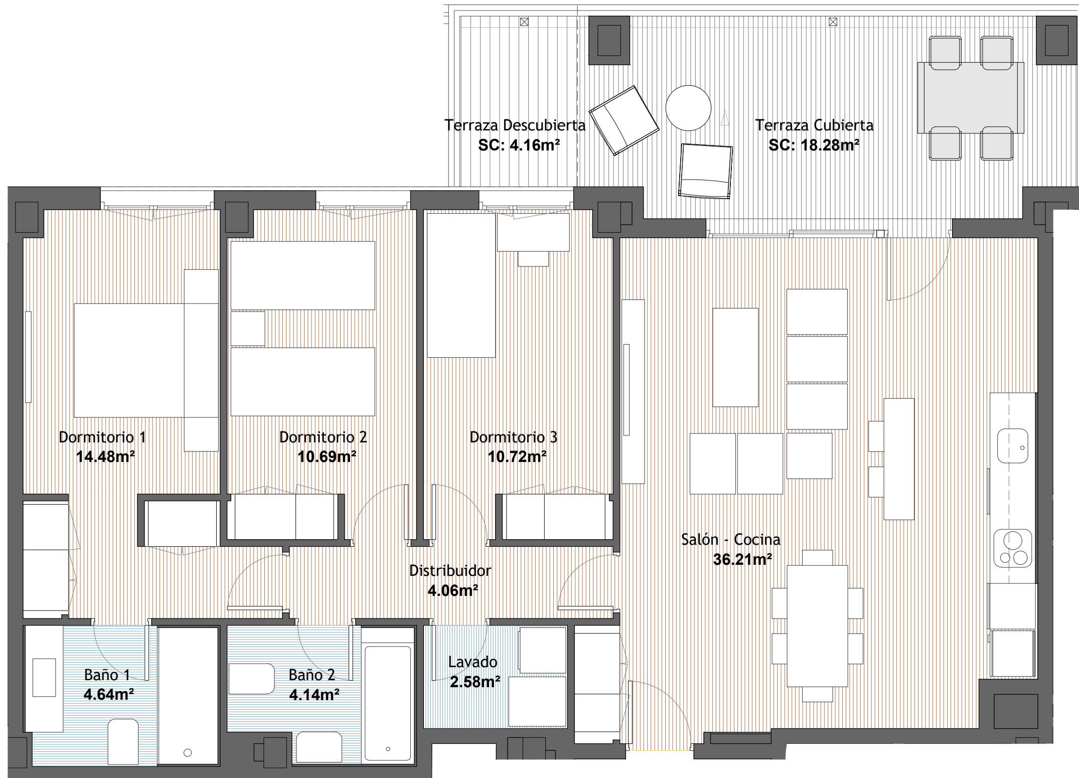
A3 - 1:50